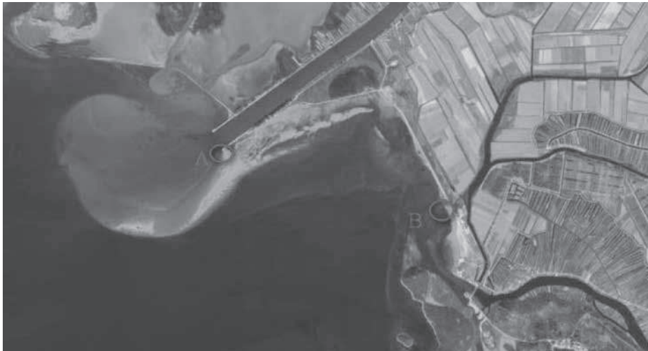
Slika 1. Područje uzorkovanja: A – postaja ušće Neretve (43° 01' 08" N; 17° 26' 43" E) i B – postaja ušće Male Neretve (43° 00' 51" N; 17° 28' 04" E)