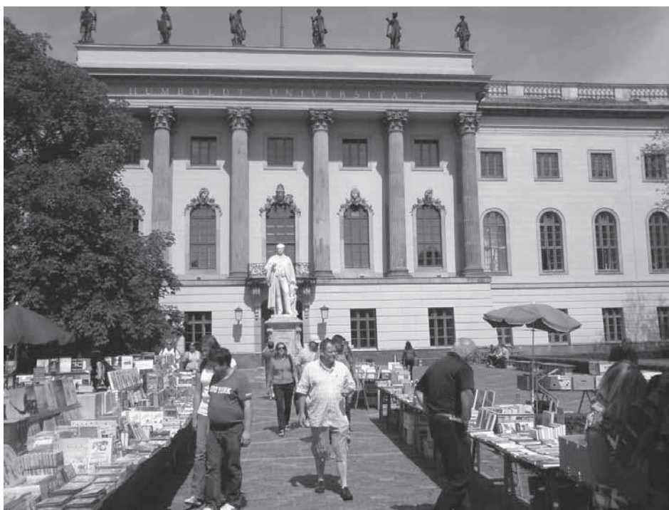
Slika 1: Na ulazu Humboldtovog sveučilišta povoljno se prodaju sveučilišni udžbenici Fig. 1: At the entrance of the Humboldt University there are discount sales of university textbooks