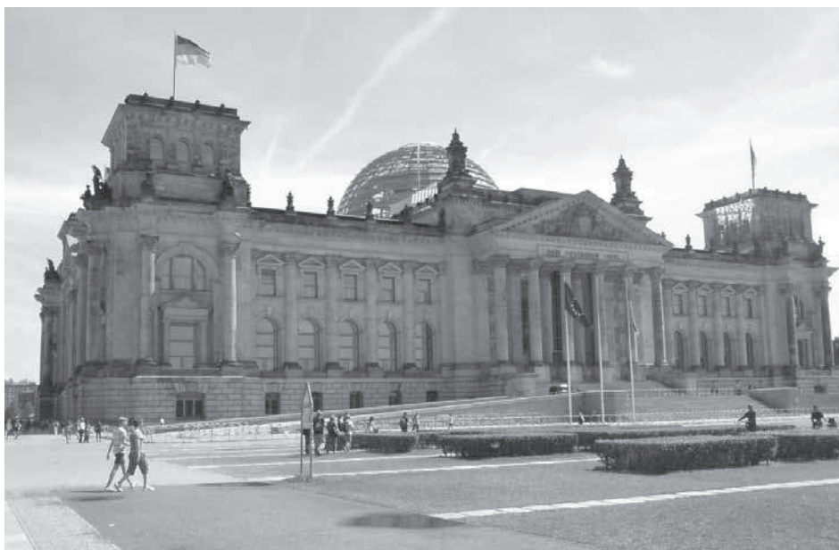
Slika 5: Reichstag, jedna od znamenitosti kraj koje protječe rijeka Spree