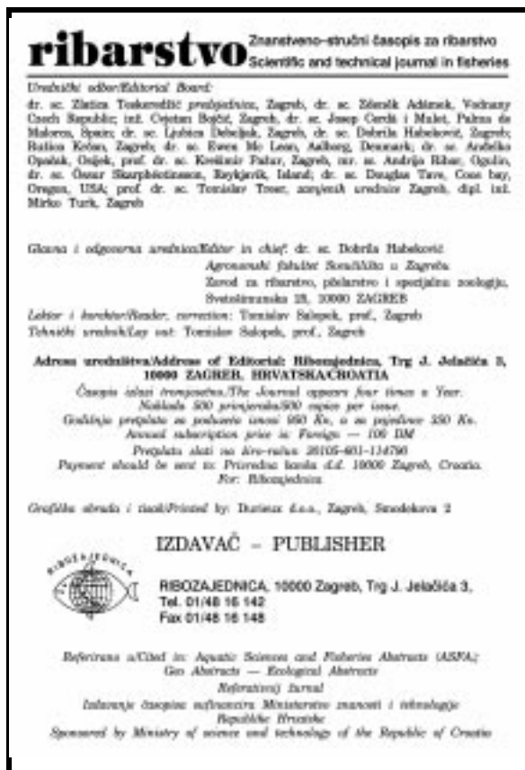
Slika 10. Osnovni podatci o časopisu »Ribarstvo« iz godine 1998.

Picture 10. Basic data on the Ribarstvo magazine from 1998