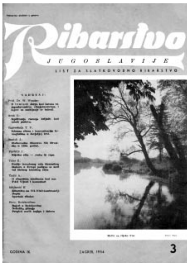
Slika 5. Naslovna stranica »Ribarstva Jugoslavije« iz godine 1954. pokazuje motiv rijeke Une Picture 5. Cover of the Ribarstvo Jugoslavije magazine from 1954, showing a motif from the Una river

U svojem razvitku ovaj časopis, osim toga što mijenja ime, mijenja i formu, vlasnika, nakladnika, oznaku ISSN, godišnju dinamiku izlaženja, no stalno prati suvremene načine u publiciranju znanstvenih i stručnih časopisa, te nastoji časopis podići na što višu razinu. Neki najbitniji podatci izneseni su u daljnjem tekstu, a na slikama 5.–8. prikazane su neke od naslovnih stranica ovitka.