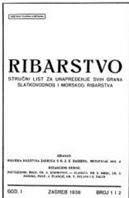
Slika 3. Naslovna stranica »Ribarstva« iz godine 1938.