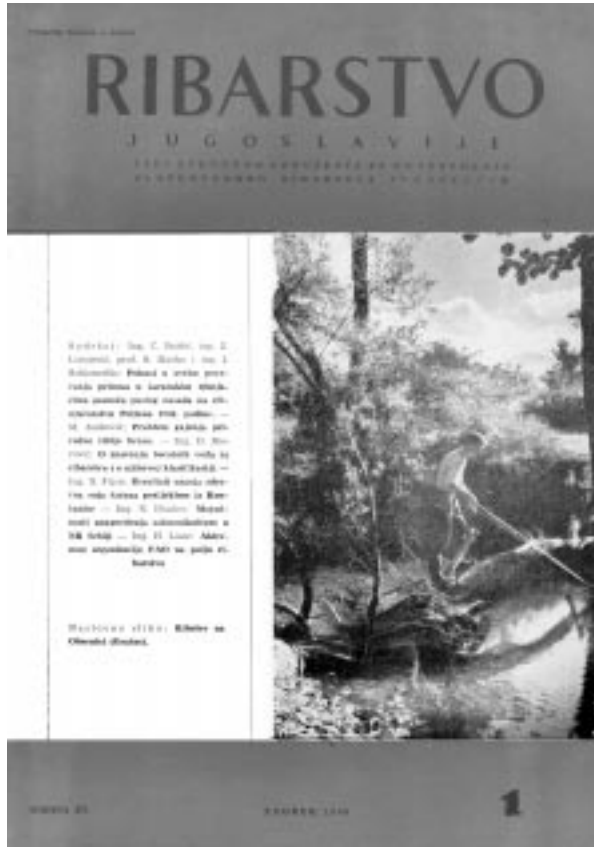
Slika 6. Naslovna stranica »Ribarstva Jugoslavije« iz godine 1960. pokazuje ribolov na Opsenici (Gračac) Picture 6. Cover of the Ribarstvo Jugoslavije magazine from 1960, showing fishing on the Opsenica river (Gračac)