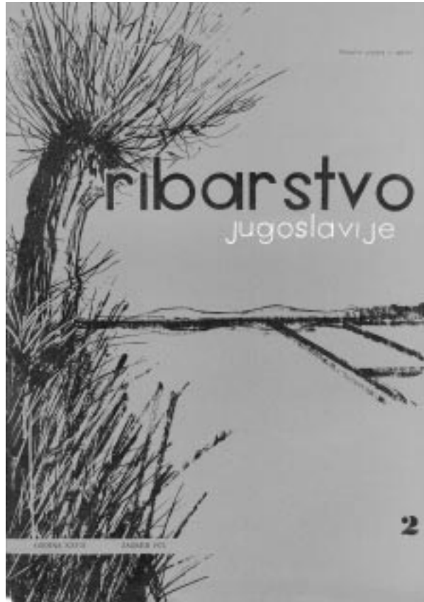
Slika 7. Naslovna stranica »Ribarstva Jugoslavije« iz godine 1972.

Picture 7. Cover of the Ribarstvo Jugoslavije magazine from 1972