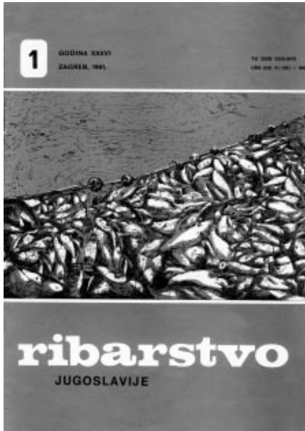
Slika 8. Naslovna stranica »Ribarstva Jugoslavije« iz godine 1981. pokazuje mrežu punu ribe — izlova na ribnjačarstvima — iz doba visokih prinosa

Picture 8. Cover of the Ribarstvo Jugoslavije magazine from 1981, showing a full fishing net — catch on fish-farms — times of rich crops