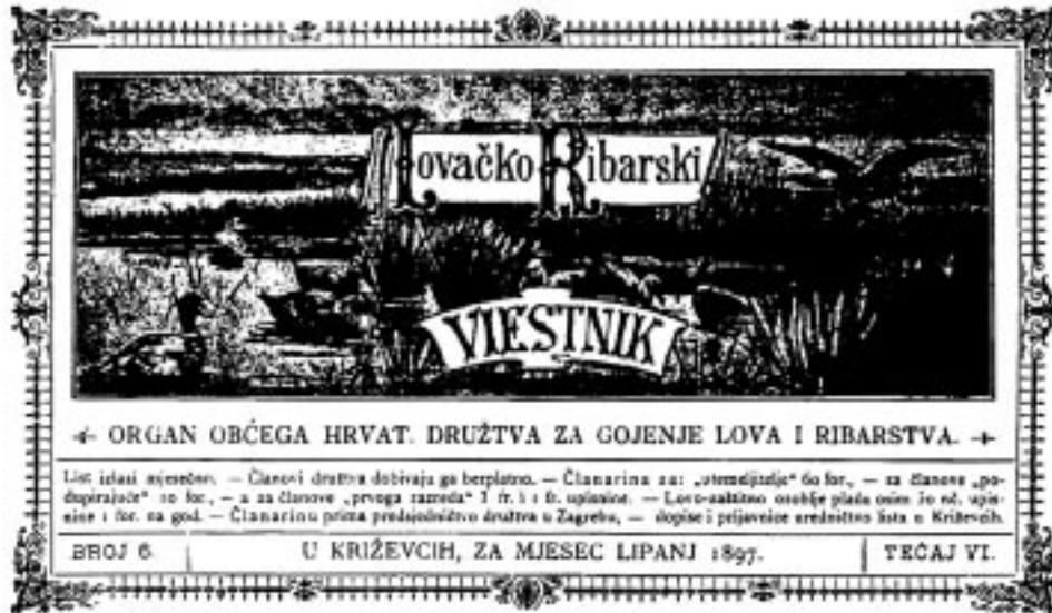
Slika 2. Bogato ilustrirana naslovna stranica »Lovačko ribarskog viestnika« iz godine 1897.