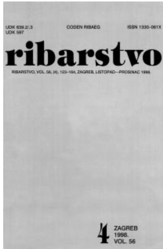
Slika 9. Nova naslovna stranica »Ribarstva Jugoslavije« iz godine 1992.

Picture 9. The new cover of the Ribarstvo Jugoslavije magazine from 1992