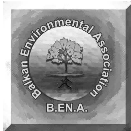
Slika 1. Logotip (znak) B. EN. A.-e Fig 1: Balkan Environmental Association logo

Programom je bilo predviđeno 11 sekcija iz područja agronomskih znanosti, a sudjelovali su mnogi ugledni znanstvenici iz Bosne i Hercegovine, Slovenije, Makedonije, Srbije i Crne Gore, Bugarske, Rumunjske, Mađarske, Poljske, Litve, Češke, Slovačke, Irana i dr.